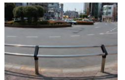
吉川駅南口ロータリー身体障がい者駐車用空間整備工事