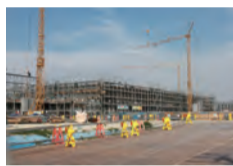
吉川中学校開校に向けた工事