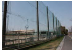
中央中学校防球ネット設置工事