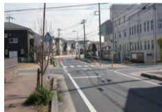
美南地区「ゾーン30」路面標示工事