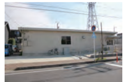
美南学童保育室整備工事